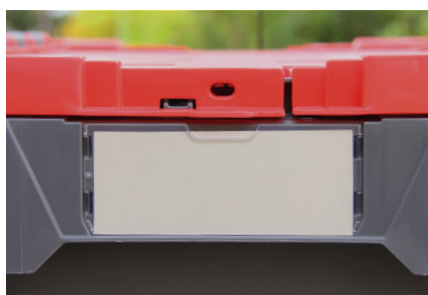
* חלופית עבור מדבקה או תווית