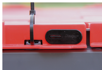
* מנגנון נעילה וזיהוי פתיחה