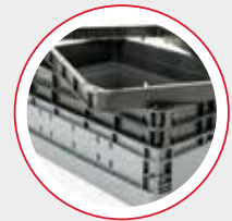
מסגרות מתפרקות לתוספת גובה