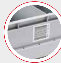
שילוב טכנולוגיות עקיבה